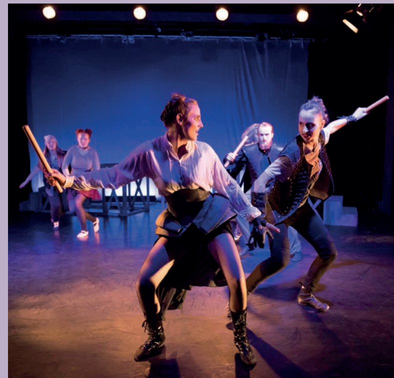
Foto aus: Romeo und Julia ... | Tanztheater-Produktion des Jugendclubs Mönchengladbach