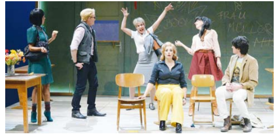
Der nächste Theater Tipp erscheint am 9. Oktober 2016.