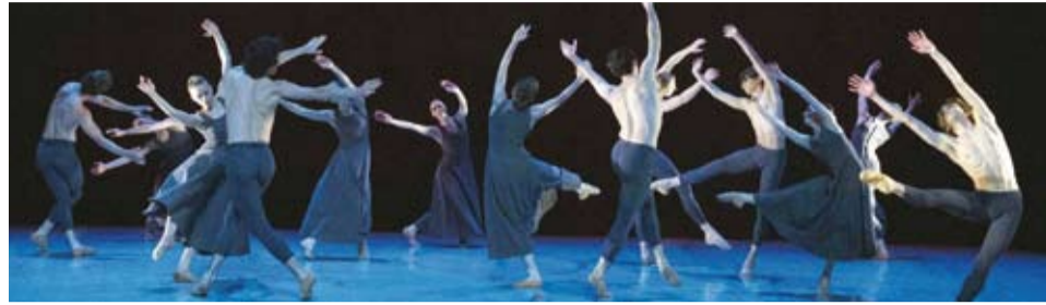
Das Ballettensemble erzählt vom Lauf des Lebens.