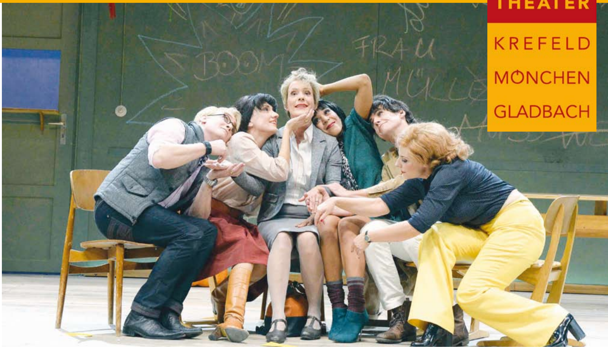
Auf Kuschelkurs? Das täuscht, denn in „Frau Müller muss weg“ fliegen die Fetzen.