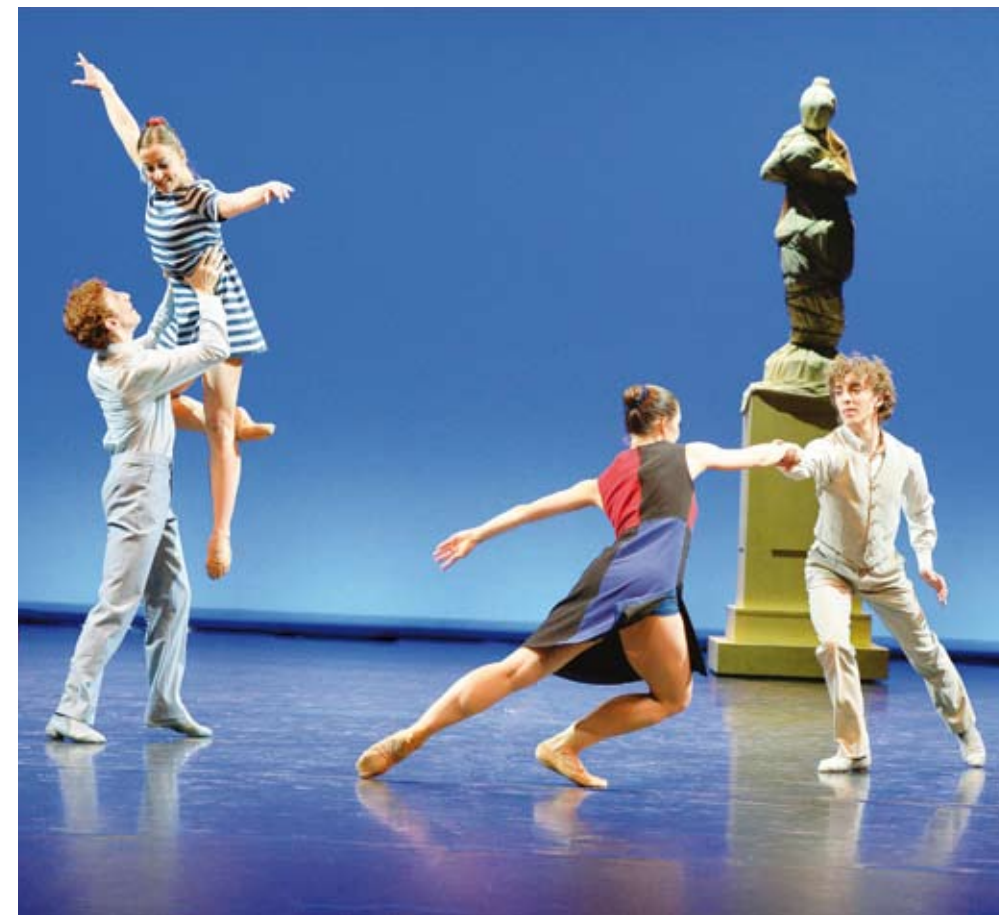
Spannend: Das Ballett erzählt von der Begegnung zwischen Mann und Frau.